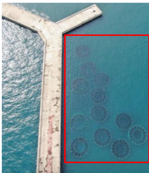
圖 1 洲際貨櫃中心生態潛堤之生態調查及生態水下攝影工作位置示意圖